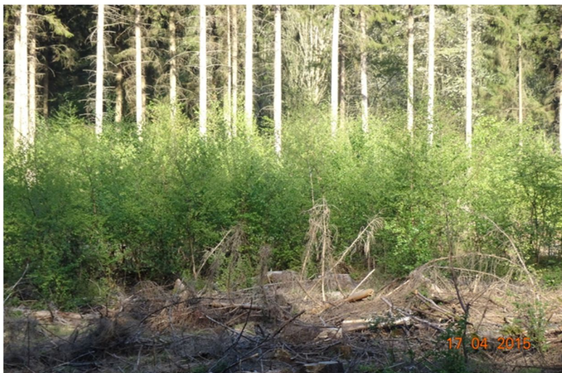
Abb. 3: Nach dem Absterben von Fichten durch Borkenkäferfraß saamen sich schnell Pionierbäume wie Birken von alleine an wie hier im Revier Ritzerau. Wer hier den Boden mit Maschinen abschiebt und neue Pflanzen einbringt, zerstört das natürliche Gefüge und vergeudet viel Geld

Die 5.000 Hektar des Stadtwaldes Lübeck liegen im norddeutschen Tiefland auf 1 bis 95 Meter Höhe über Meereshöhe verteilt. Die durchschnittliche Jahrestemperatur betrug im Mittel der letzten Jahrzehnte 8,5 Grad Celsius, der durchschnittliche Niederschlag lag bei 650 bis 700 Litern pro Quadratmeter. Der Wald sieht auch im Klimawandel noch ziemlich vital und anpassungsfähig aus. Ähnliche Beobachtungen wurden in 37 Naturwaldreservaten Deutschlands gemacht, in denen die Entwicklung der standortheimischen Baumarten, speziell auch der Buchen, innerhalb der letzten Dekaden vom Klimawandel nicht merklich beeinflusst worden waren (Meyer, P. et al. 2017). Niemand weiß, in welcher Weise der Klimawandel sich entwickeln wird, und welche Auswirkungen das haben wird. Das Lübecker Konzept baut auf die Anpassungsfähigkeit komplexer naturnaher Waldökosysteme. Ähnlich argumentieren Ibisch et al. und Hussendörfer im Buch Der Holzweg im Kapitel „Wald im Klimawandel“.