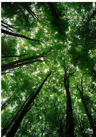
Abb.1: Auf der Referenzfläche "Schattiner Zuschlag" im Stadtwald Lübeck genießt der Wald völligen Prozessschutz. (Photo: Lutz Fähser).

Je näher sich die Wirtschaftswälder in Deutschland an der seit der letzten Eiszeit in der Evolution durch Selektion und Epigenetik entstandenen „natürlichen“ Verfassung befinden, umso leistungsfähiger sind sie. In einem Großforschungsprojekt im Solling hat der Ökologe Ellenberg diesen Zusammenhang an den dortigen Buchenwäldern gerade im Vergleich mit gepflanzten Fichtenwäldern, den „Brotbäumen“ der klassischen Forstwirtschaft, bestätigt gefunden. Voraussetzung sei allerdings, dass die Wälder dicht geschlossen, also mit Pflanzen bis zu ihrer natürlichen Tragfähigkeit „gesättigt“ seien (Ellenberg 1978). Auf den 10 Prozent Referenzflächen mit völligem Prozessschutz richten sich in Lübeck die Bäume miteinander ein. In dem 120jährigen Buchenwald „Schattiner Zuschlag“ stehen rund 1.000 m 3 Baumholz auf jedem Hektar, etwa dreimal soviel wie im Durchschnitt der Wälder in Deutschland.