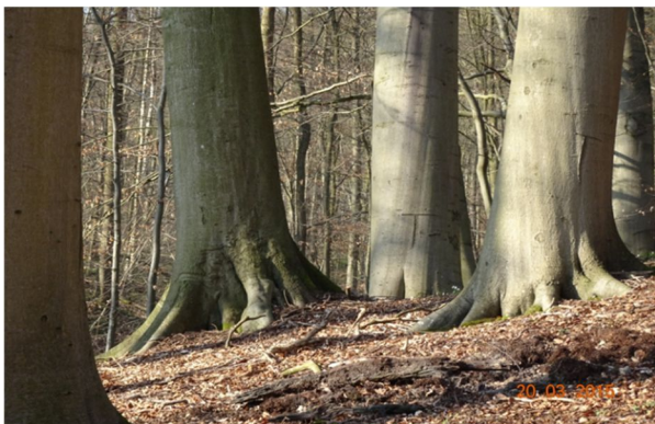
Abb. 2: Im Stadtwald Lübeck entwickelt sich ein naturnaher Dauerwald. Alte und junge Buchen wachsen auf dem "Taubenberg" eng miteinander auf.

Zu Beginn der Konzeptentwicklung im Jahre 1986 galten in Lübeck die Ziele und Durchführungspläne der vorherigen Inventur und Planung. Sie basierten auf der klassischen deutschen Waldbaulehre und auf wenig realistischen Ertragstafeln für den Vorrat und den Zuwachs von Baumholz. Hergeleitet waren sie aus wissenschaftlichen Studien in gleichaltrigen Reinbeständen von jeweils nur einer Baumart. Zwischen diesen Modellen und den darauf aufgebauten Wirtschaftsplänen und der neuen Vorstellung eines naturnahen superkomplexen Waldökosystems mit eigendynamischer Entwicklung klaffte eine Lücke von unbekannter Größe und Qualität. Die neue Inventur von 1992 konnte zwar realistische Zustandsdaten liefern, nicht aber hinreichende Informationen über die zu erwartende zukünftige Dynamik. Um diese natürliche Entwicklung nicht weiter zu unterdrücken, wurden in Lübeck nicht mehr zeitliche und quantitative Betriebszieltypen oder Waldentwicklungstypen formuliert, sondern Bedingungen für eine weitgehend natürliche Entwicklung. Gesetzte Struktur wurde durch Zulassen natürlicher Dynamik ersetzt. Das erschien vielen als ziellos. Sie waren es gewohnt, messbare Vorgaben aus der Forsteinrichtung umzusetzen, unabhängig davon, welche natürliche Dynamik tatsächlich im Wald herrschte.